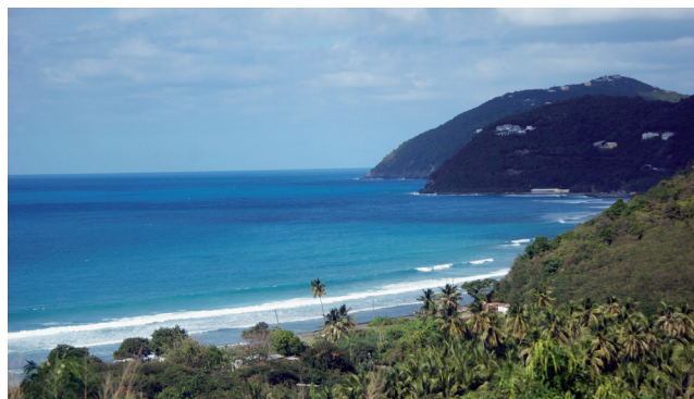
s automatickou kalibrací IT8

S novým programem SilverFast Ai IT8 dostávají profesionálové i začátečníci správnou barevnost a nemusí se starat o zvládnutí náročné techniky kalibračního procesu. Patentovaná kombinace automatického vyhledávání rámu a integrované technologie Barcode (na originálních testovacích obrazcích LaserSoft Imaging IT8) umožňuje automatický průběh celé kalibrace. Stačí jen položit LSI-obrazec na skener a zahájit kalibrační proces IT8. Dvě minuty a kliknutí myši a skener poskytne barevně absolutně věrné výsledky!