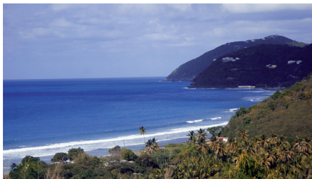
Bez automatické kalibrace IT8